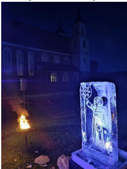
Renginių ciklas „Bažnyčios naktys“