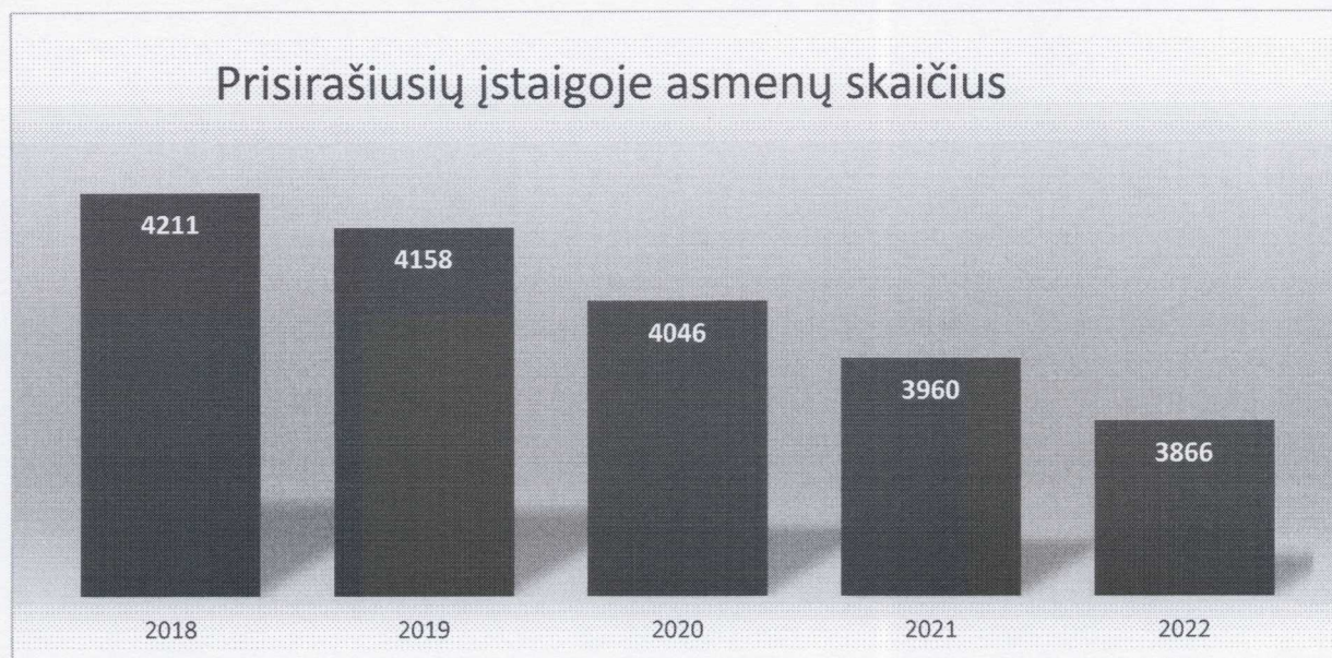
1 pav. Prisirašiusių įstaigoje asmenų skaičius 2018-2022 metais